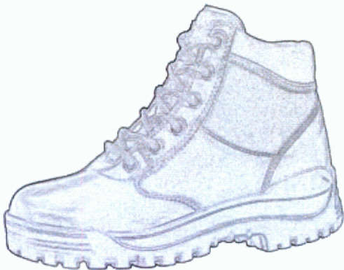
Buty letnie na grubej podeszwie.

Czapka polowa zimowa koloru szarozielonego z wizerunkiem orła ze wstęgą z napisem „SŁUŻBA CELNA”, wykonanymi haftem maszynowym.